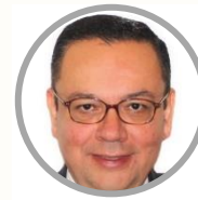
Senador Germán Martínez Cázares.