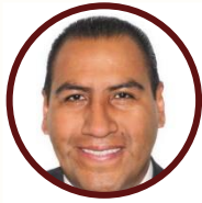
Senador Eduardo Ramírez Aguilar.