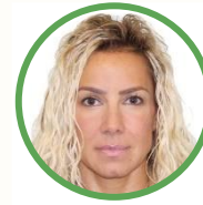
Senadora Alejandra Lagunes Soto Ruíz.